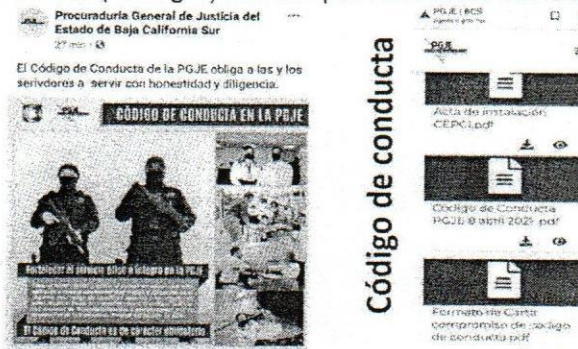
Fig. 1 Publicación de Código de Conducta en páginas oficiales de Procuraduría General de Justicia

Para el acuerdo 02/01OR/2021 , muestra imágenes de la página oficial de Facebook y la página web de la dependencia (ver fig.1) con las publicaciones del Código de Conducta.